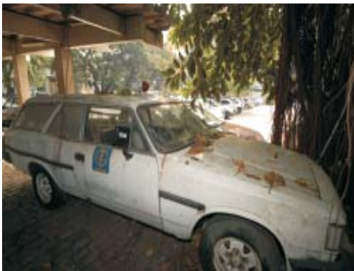
Ambulâncias Sucateadas - Hupe