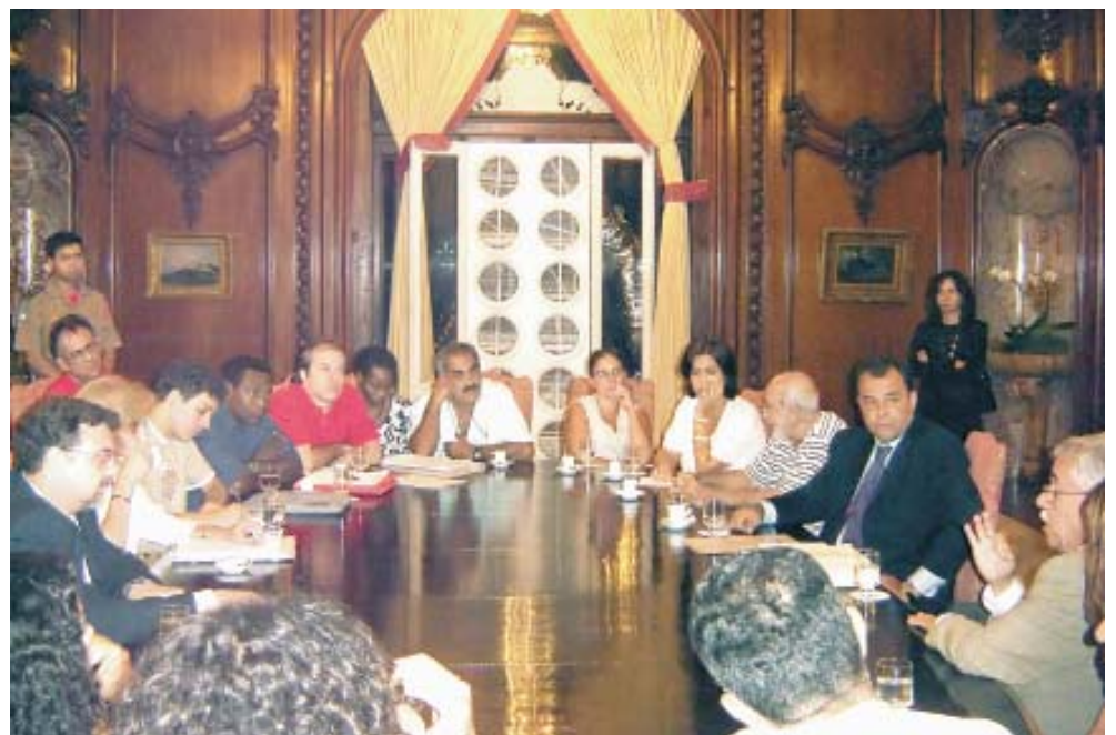
Sintuperj discute Uerj com o governador

O governador disse que a universidade é prioridade em seu governo. Chegou a propor um "SOS Uerj". Mas essa proposta vinda do governador assusta. Ele deveria apontar soluções para a universidade e não um SOS. As entidades cobraram solução para a situação da universidade, principalmente, sobre a necessidade do reajuste salarial. Cabral solicitou aos secretários que houvesse o repasse necessário para as obras da rampa e para o custeio da universidade. O Sintuperj lembrou ao governador que, na época em foi Presidente da Alerj, ele intermediou o acordo para recompor as perdas salariais. Segundo ele, agora o Estado não tem a mesma possibilidade financeira.