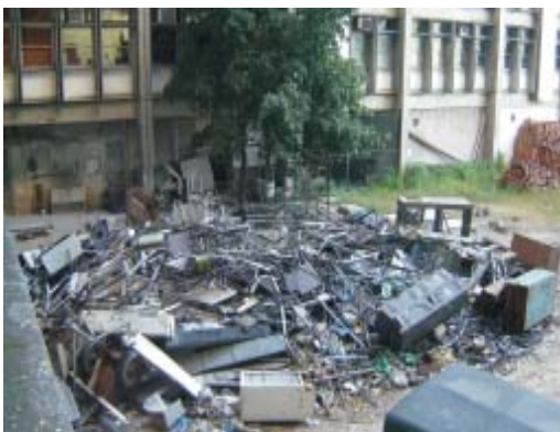
"Lixão" no Campus Maracanã - Uerj

Há várias áreas abandonadas na Uerj. O lixão formado entre os blocos D e E do Campus Maracanã demonstra o descaso da Administração e do Governo do Estado com a Universidade. Dezenas de carteiras, armários e outros equipamentos estão jogados no local. Além de depredar o patrimônio público, tal situação propicia à reprodução de insetos, tornando-se foco de doenças. O risco de Dengue na universidade, com certeza, cresce nessas circunstâncias.