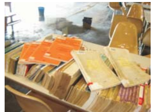
Goteiras destroem acervo das Bibliotecas - Uerj