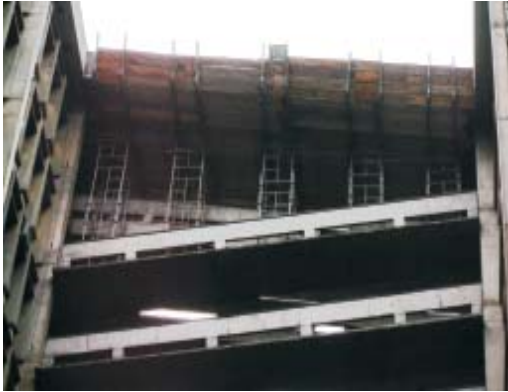
Marquise 12º andar - Uerj