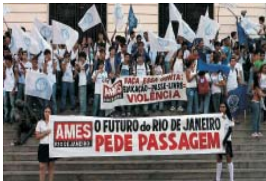
Estudantes protestam contra a suspensão do passe livre

manifestação dos estudantes. Nada justifica a violência. Mas as autoridades não punem, não batem, não mandam a polícia prender os empresários, não retiram a concessão. Por que somente os estudantes são