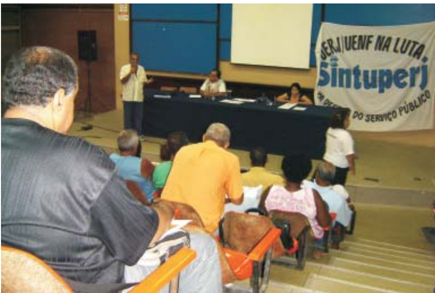
Assembléia consolida mobilização dos servidores

A assembléia geral dos servidores realizada na quinta-feira, 12/04, consolidou o processo de mobilização dos trabalhadores da Uerj, iniciado com a eleição da atual diretoria. Somente este ano, o Sintuperj participou de várias audiências públicas, reuniões com a reitoria, com o governo e agora diretamente com o governador. Durante a assembléia, após avaliação da reunião com o governador (veja o relato abaixo), os servidores e o Sintuperj aprovaram as seguintes atividades: 1. Realizar, na comunidade, consulta sobre as eleições na Uerj. 2. Aproveitar reunião já marcada com a Asduerj e o DCE para propor uma assembléia comunitária.