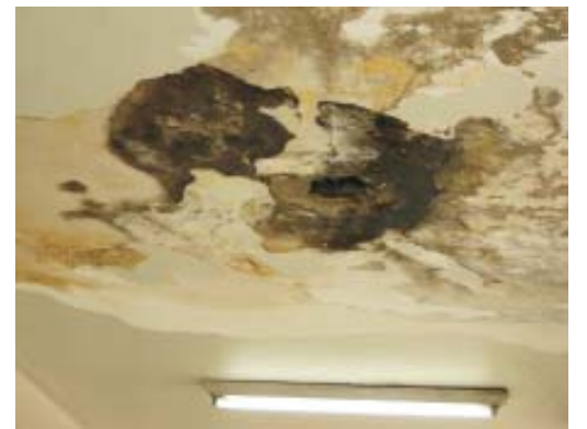
Teto Radiologia - Hupe