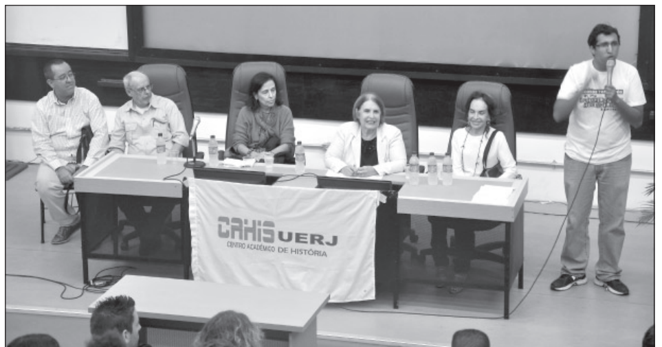
Família de João Goulart recebe homenagem ao Presidente