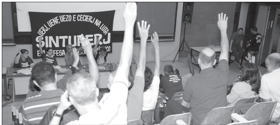
Técnicos aprovam participação no Dia de Luta contra a Terceirização

Atendendo deliberação da última assembleia, o Sintuperj encaminhou nesta quarta-feira (07/08) ofício com pedido de audiência sobre a reformulação do Plano de Cargos e Carreira (PCC), em caráter de urgência, ao governador Sérgio Cabral. O do-