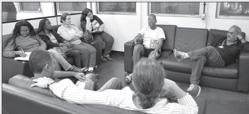
Diretório Central dos Estudantes recebeu os três segmentos