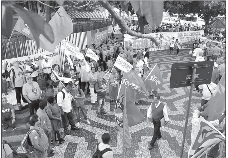
Trabalhadores reunidos em frente à Central do Brasil

Sindicalistas destacaram a grande quantidade de trabalhadores terceirizados que não receberam direitos trabalhistas, inclusive salários, após empresas de prestação de serviços simplesmente “desaparecerem”. Enfatizaram também o alto índice de acidentes de trabalho com os terceirizados, que já supera os ocorridos com os efetivos devido ao descumprimento das normas de segurança e saúde. Números que podem ficar ainda piores com