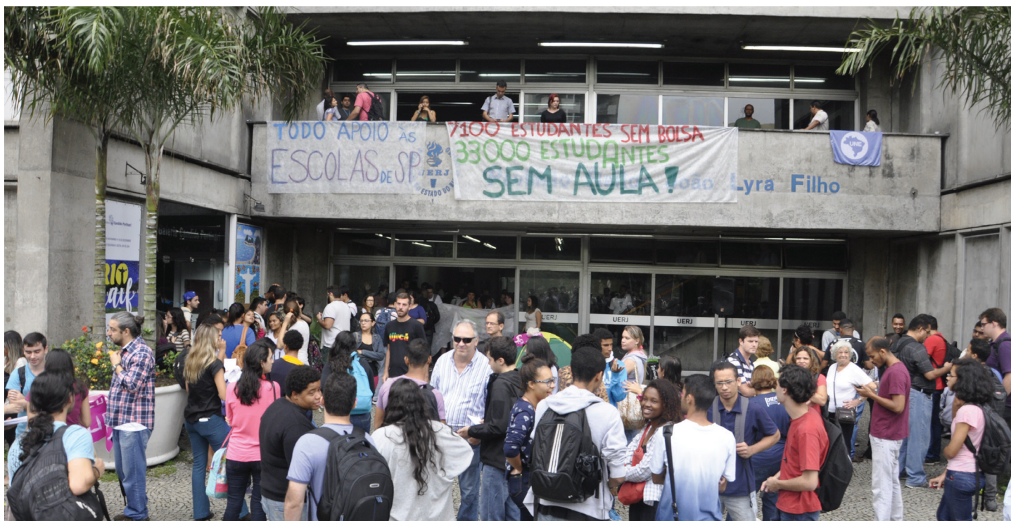
Estudantes fecharam as entradas do Pavilhão João Lyra Filho da Uerj nesta segunda-feira (01/12)

E studantes da Uerj ocuparam na noite de segunda-feira (30/11) o Pavilhão João Lyra Filho e a Faculdade de Formação de Professores (FFP – campus São Gonçalo) da Universidade. Organizados pelo Diretório Central dos Estudantes (DCE), eles reivindicam uma posição da Reitoria e do Governo do Estado em relação ao pagamento das bolsas e salários dos trabalhadores terceirizados.