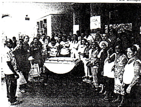
Aniversário de fundação do Sintuperj 31 de outubro

Representantes dos sindicatos dos médicos e enfermeiros estiveram na manifestação não apenas para saudar aos trabalhadores da Uerj, mas também para reafirmar o compromisso com o serviço público estadual universal e de qualidade. As duas categorias expressaram indignação e alarme em relação a “reforma” da saúde para o Estado, proposta pelo governador Sérgio Cabral,