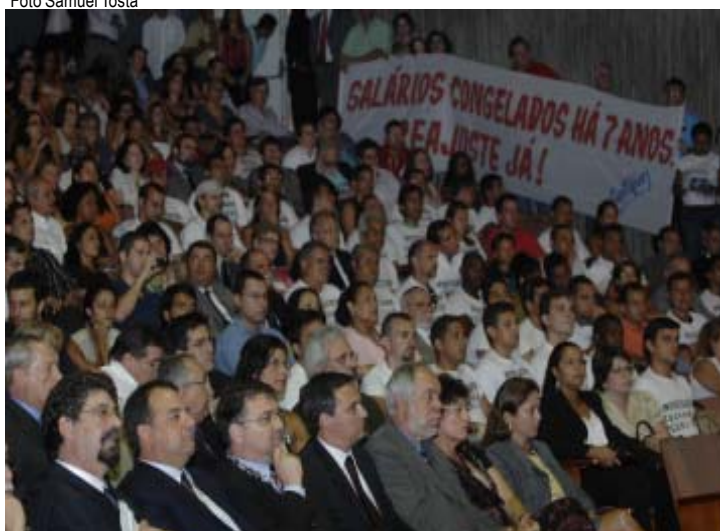
Manifestação do Sintuperj na posse do reitor

Em seu discurso, diante de um Teatrão lotado, o governador reconheceu a necessidade do reajuste salarial e, novamente, utilizou-se da metáfora de que a Universidade é a “jóia da coroa” do governo, pela qualidade dos seus trabalhadores e estudantes. Se esta afirmação de fato é verdadeira, cabe perguntar: Então governador, o que falta para resolver, concretamente, esta situação e anunciar o nosso reajuste?